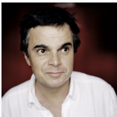
Alexandre Jardin

Le romancier Alexandre Jardin vient de publier « Laissez nous faire! On a déjà commencé ». Même s'il laisse une place au récit intime, cet ouvrage tient surtout du manifeste pour le mouvement « Bleu Blanc Zèbre » que l'auteur a lancé. Avec celui-ci, Alexandre Jardin invite chaque citoyen à apporter sa propre solution aux « maux de la société française ».